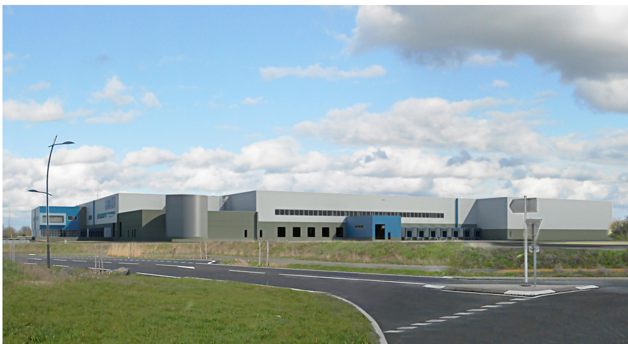
Insertion du projet dans son environnement.